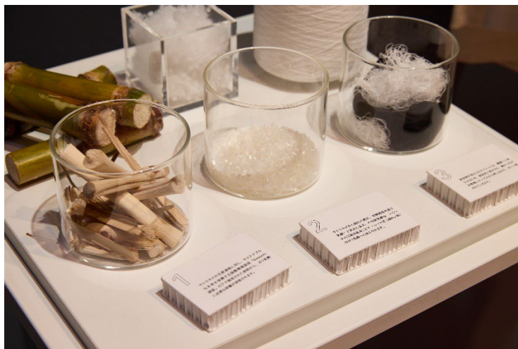
本年4月に開催したヤギグループ総合展での展示(Plaxの原料)の一部

この他にも、使用済PETボトルを原料とした糸や、工場内で発生するナイロン糸くずを原料とした糸に、ヤギと親交の深い北陸企業の技術力を加えて完成するリサイクル糸ブランド「UNITO polyester」・「UNITO nylon」など、当社の取り扱う環境配慮型素材を取り揃えて展示します。